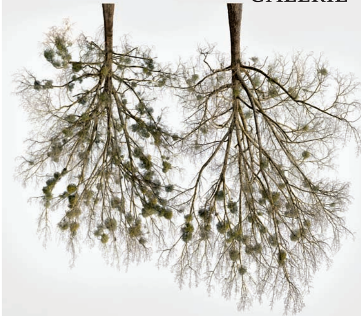
© Christoph Franke: Tree Crowns 05