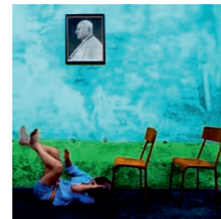
© Margret Paal: A cappella cadere a terra

Mit einem kritischen, aber wertefreien Blick macht das Langzeitprojekt „Deutschland und seine Hauptstraße 13“ auf die verschiedenen Lebensräume und Lebensbedingungen in den 16 deutschen Bundesländern aufmerksam. Es wurden von der Künstlerin bisher über 12.000 km durch alle Bundesländer zurückgelegt, um die Adressen „Hauptstraße 13“ zu finden und zu fotografieren. Mit dem Werk „a capella“ setzt sich Margret Paal mit dem Thema Glaube & Hoffnung, insbesondere mit der römisch-katholischen Kirche auseinander.