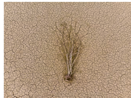
© Tobias Melle: Pastorale, 4. Satz

Die Visualisierung sinfonischer Musik setzt Tobias Melle in seinen Sinfonien in Bildern auf der Bühne mit renommierten Orchestern und Dirigenten um. Dabei geht es um eine strukturell und emotional stimmige Übersetzung der musikalischen Zusammenhänge in eine assoziative Bildfolge. Die so komponierte visuelle Stimme zum Orchesterklang bringt er persönlich und live zur Aufführung – wie ein musikalischer Solist passt er sich an die Interpretation des Dirigenten an. Aus den Fotoarbeiten spricht seine große Verbundenheit mit der Natur.