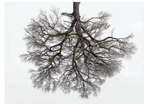
© Christoph Franke: Tree Crowns 04

Mit der Kamera tastet Christoph Franke Bäume in einer Art Kontaktverfahren mit vielen Einzelaufnahmen ab, die er anschließend zusammensetzt. Die Fotografie wird zum Zeugnis einer Begegnung. Durch Abstraktion und Loslösung von räumlichen Bezügen wandelt er den Baum vom reinen Naturobjekt zu etwas Wesenhaftem. Christoph Franke ist inspiriert von der Vorstellung, dass Fotografien ähnlich wie Wasser Energie speichern und abgeben.