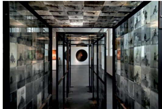
Hutmuseum Lindenberg - Generationentunnel

Beim Ausräumen des Elternhauses fand Max Schmelcher auf dem Dachboden die alten silberbeschichteten Fotoplatten des Großvaters, der Fotograf gewesen war. Abgebildet sind Leute aus dem Westallgäu aus den Jahren ca. 1915 bis 1935. Daraus entstanden Installationen, mitunter der Generationentunnel. Die silberbeschichteten Fotoplatten spiegeln den Betrachter wider, sind zugleich transparent und fügen sich zu einer dreidimensionalen Installation zusammen.