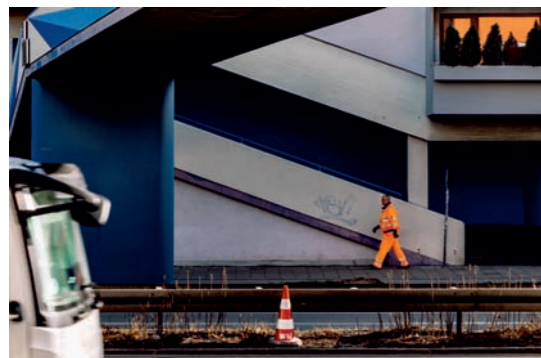
© Olaf Wiehler: Mittlerer Ring 4, München, 2022

Die Fotoserie MITTLERER RING ist 2022 in unmittelbarer Nachbarschaft des Künstlers, im Münchener Stadtteil Obergiesing, entstanden. Die Serie enthält Elemente der Street Photography und der Architekturfotografie. Olaf Wiehler möchte damit eine Verbindung zwischen dem Menschen und seinem Lebensraum aufzeigen und den Menschen, die - auch in Deutschland - versuchen, ihre oftmals alternativlosen Lebensräume zu gestalten, ein Gesicht geben.