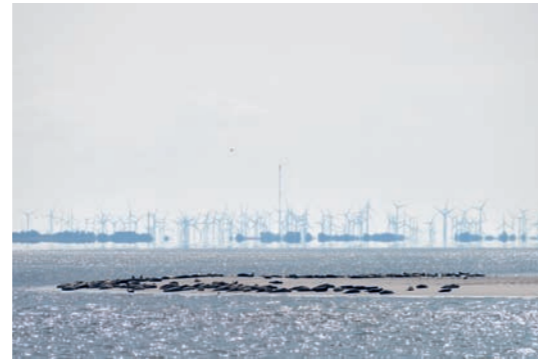
wooge fata morgana 6KS2645

Kees van Surksun sammelt fotografische Eindrücke zu diversen eigenen Themen. Mit der Bildserie „Energiewälder“ will er die Veränderungen in der urbanen und ländlichen Kulturlandschaft zeigen. Die regenerative Energieversorgung hinterlässt bereits jetzt schon deutliche Spuren in der Landschaft. Die Bilder wollen zum Ausdruck bringen, dass die Veränderungen nicht unbedingt schlecht sein müssen und dass sie auch mit einer gewissen Ästhetik einhergehen können.